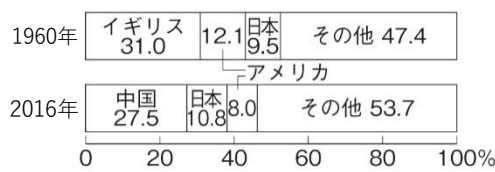
資料2 オーストラリアの貿易相手国の推移